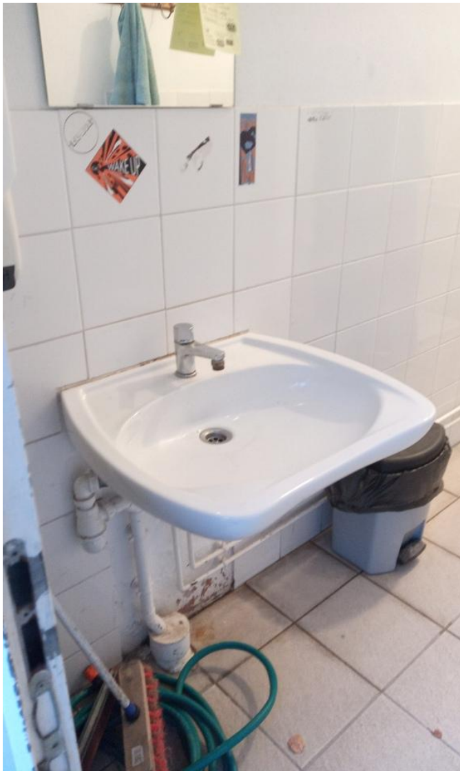
Pas de vis (diamètre ?)