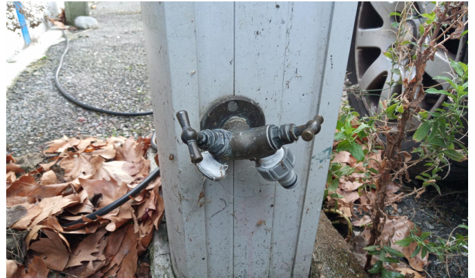
1 téton garden + 1 pas de vis (diamètre ?)